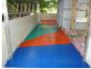
走廊色彩圖案活潑。