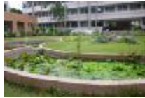
梅花池，是綠意盎然的生態池。