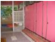
完工後的廁所通風採光良好。