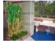
回收雨水做為拖把洗濯之用。