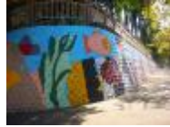
駁坎彩繪，充滿熱情和夢想。