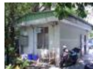
雜亂的庭園角落，成為侏羅紀生態區。