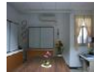
廢置的空間成了民俗體育展示室和辦公室。