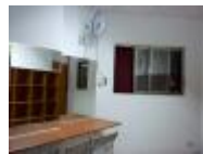
改造後的舞蹈教室和化粧室。