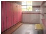
體貼的設計和無死角的空間。