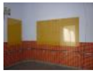
轉角藝廊的展示板。