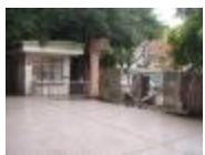
閒置單調的廣場，改造成星球廣場。