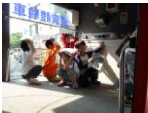
◎地震時疏散到操場