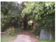
原來是陰暗的角邊，成為小朋友最愛的地方。