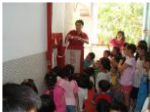
◎示範滅火器使用方法