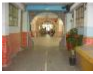
規劃展示空間及專業照明。