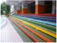
階梯色彩美麗並有防滑效果。