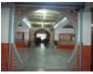
塑造走廊拱門意象。