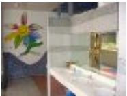
使用方便的大洗手台和明鏡。