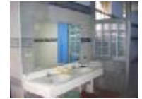
使用可回收鋼材及玻璃磚。

「創新、活化、再利用」為校園營造的理念，除了老舊空間再利用、閒置空間活化，並融入綠建築概念，達成校舍美化永續的優質目標，並提昇老舊學校的活力和形象及永續發展。期許每一個小朋友都能成為充滿陽光的明道兒童，畫下自己一頁美麗的色彩。