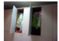
將空間畫分為專業音控室和服裝管理室。